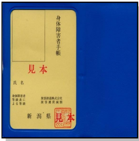
既存の手帳 (順次更新)