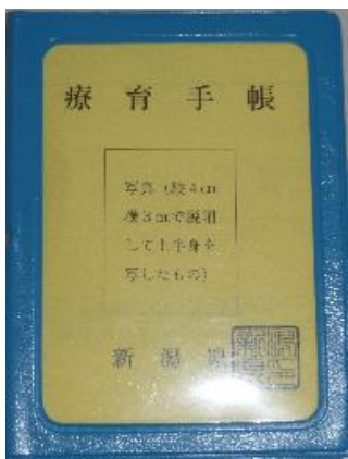
新潟市以外の 市町村発行