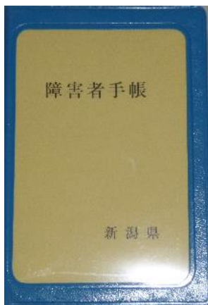
新潟市以外の 市町村発行