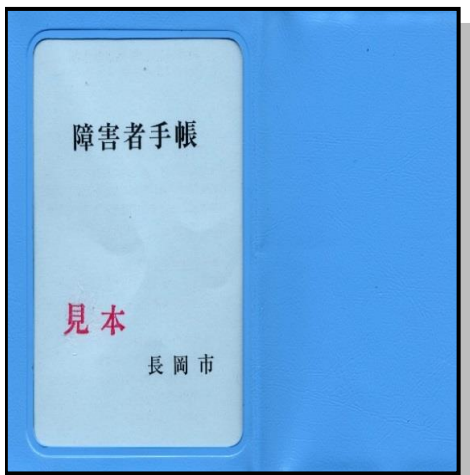
既存の手帳 (順次更新)